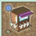
1 szuvenír bolt